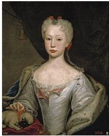
La reina Bárbara de Braganza. 1725.

El repertorio musical que contiene el manuscrito de El Libro secreto de Bárbara de Braganza , descubierto recientemente, estaba destinado a ser interpretado por la Real Cámara, la orquesta al servicio de los monarcas, en sus estancias privadas. El encuentro con los músicos anterior al concierto, nos hará partícipes de los secretos de esta música íntima y nos permitirá disfrutar plenamente de este concierto tan singular y único.