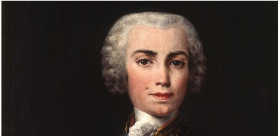
Farinelli, por Jacopo Amigoni, c. 1750-52. Retrato en la Real Academia de Bellas Artes de San Fernando.

Carlo Broschi, Farinelli, residió en España desde 1737 hasta 1760. Llegó a la Corte española llamado por la reina Isabel de Farnesio quien intentaba hacer más llevadera la “melancolía” del rey. Lo que en principio iba a ser una estancia de un mes en la Corte de Madrid se convirtió en veintitrés años de vida en nuestro país ya que ni Felipe V, ni Fernando VI quisieron verse privados de la terapia que para ellos suponía escuchar todas las noches la bella voz del cantante.