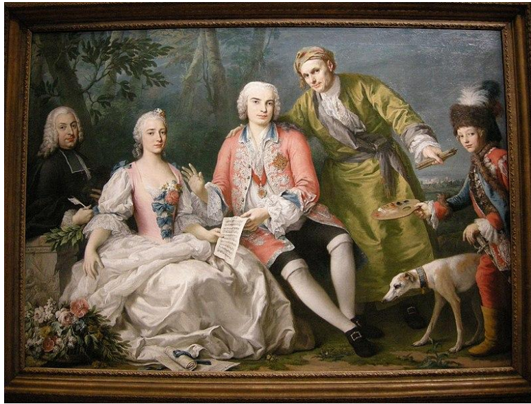
Jacopo Amigoni. Il cantante Farinelli con amici. 1750-52. National Gallery of Victoria. Melbourne. Australia